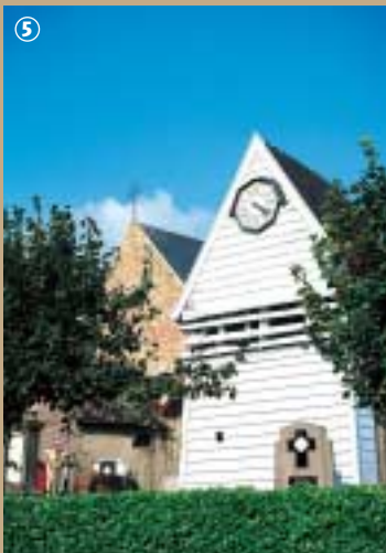
Klockhuis à Hardifort.