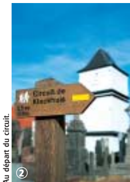
Au départ du circuit.

Ce parcours s'adresse autant au randonneur régulier qu'au promeneur occasionnel. Fermes traditionnelles et petit patrimoine religieux jalonnent l'itinéraire. La meilleure période s'étend d'avril à octobre. Certains passages humides nécessiteront le port de chaussures étanches en période de pluie.