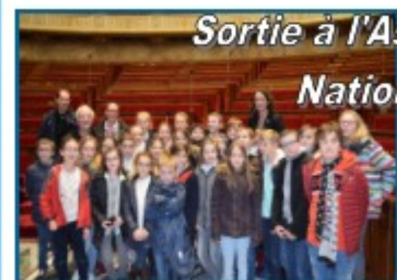
Sortie à l'Assemblée Nationale