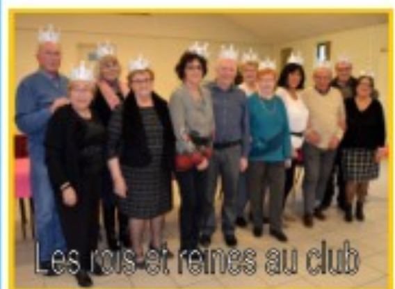
Les rois et reines au club