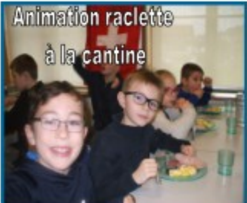
Animation raclette à la cantine